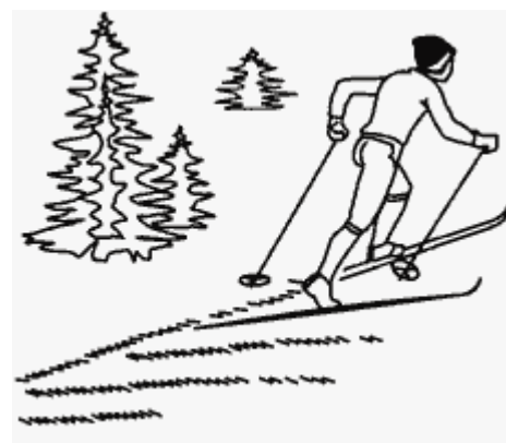
Рис. 2. Подъем полуелочкой

Подъем беговым шагом применяется на склонах средней крутизны, а при плохом скольжении и на более пологих подъемах. Переход на этот способ преодоления подъема зависит и от других факторов. При этом наблюдается значительное сокращение времени скольжения, что может привести к временному переходу на бег с фазой полета. В этом способе длина выпада в 3-4 раза больше длины скольжения. Маховые движения и подседания выполняются быстро, что позволяет поддерживать достаточно высокий темп движения. В целом способ похож на бег на полусогнутых ногах при сохранении многих деталей подъема скользящим шагом.