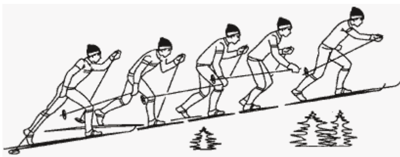
Рис. 1. Подъем скользящим шагом

Во всех этих способах нет фазы свободного скольжения и фазы скольжения с выпрямлением ноги. При подъеме скользящим шагом фазы скольжения и стояния лыжи по времени примерно равны. При преодолении подъемов любым способом большое значение имеет активная работа рук, что уменьшает возможность проскальзывания лыж при увеличении крутизны подъемов.