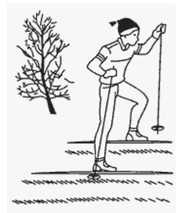
Рис. 4. Подъем лесенкой

Особых затруднений изучение этого способа не вызывает. После показа и объяснения ученики выполняют несколько приставных шагов внизу у подножия горы и сразу продолжают подъем по склону с хорошей опорой на палки. Поперечное расположение лыж по склону и постановка их на ребра (канты), опора на палки позволяют преодолевать подъемы большой крутизны (до 40^\circ ). Обычно лыжники легко осваивают этот способ подъема. Затем следует научить их подниматься по склону с продвижением вперед и назад. Ошибки, возникающие при изучении способа: недостаточное кантование лыж, их негоризонтальная постановка, плохая опора на палки.